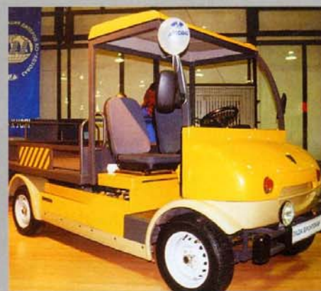
Грузовой электромобиль «Бронтокар»