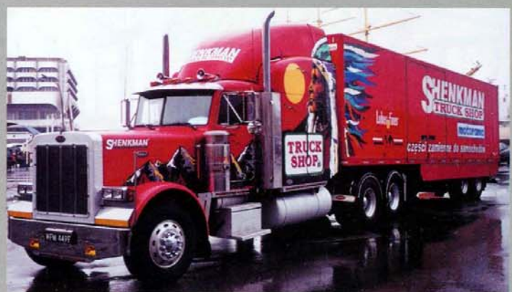
Этот Peterbilt — реклама польской фирмы «Shenkman»