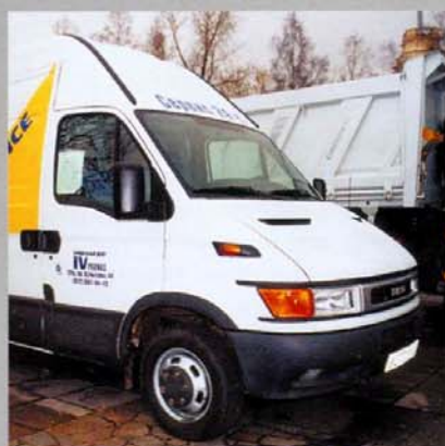
Фургон IVECO Daily 35C11V