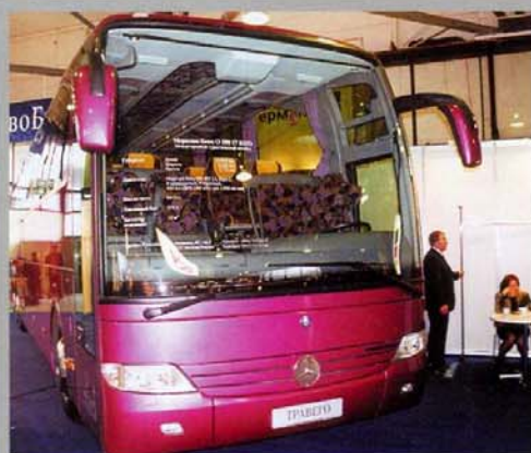
Mercedes-Benz O 58017 RHD Travego рассчитан на 46 пассажирских мест

Уже много лет известные мировые автомобильные компании действуют под лозунгом «думай глобально, действуй локально». И российский рынок не исключение. За I квартал 2001 года большинство компаний, представляющих коммерческий транспорт, смогли увеличить свои продажи по сравнению с предыдущим годом.