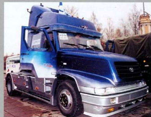
Кабина опытного УАЗ-Бурани-Стайлинг сделана из полужирного композита