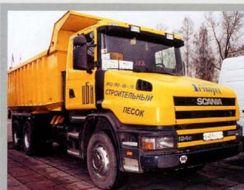
20-тонный самосвал Scania T124 C 360 (6x4) по прозвищу «Гепард»