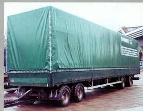
Особое место на открытых площадях отводилось прицепному составу