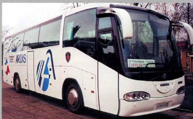
Туристический Scania K114 EB Irizar Century 12.35